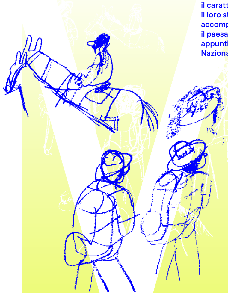
Illustrazione di Irene Penazzi

Il Rifugio Stella Alpina Al Lago Corvo è la casa popolare di chi cammina, punto di arrivo della prima giornata e di partenza della seconda. Si tratta di un soggetto estremamente stimolante da disegnare, perché ricco di particolari e di storie in corso contemporaneamente. Siamo in alta quota, al confine tra Trentino e Alto-Adige, guardiamo le cose dall'alto, intorno ci sono cime di montagne a tratti innevate e passaggi di luce resi più intensi dall'assenza di inquinamento luminoso. Nei pressi del Rifugio, il giorno successivo, raggiungiamo i laghi Corvo, di origine glaciale e incontriamo un operatore del Parco Nazionale dello Stelvio Trentino. Prima di scendere a valle, proveremo a riunire in un racconto a tante voci il nostro saliscendi nel Parco.